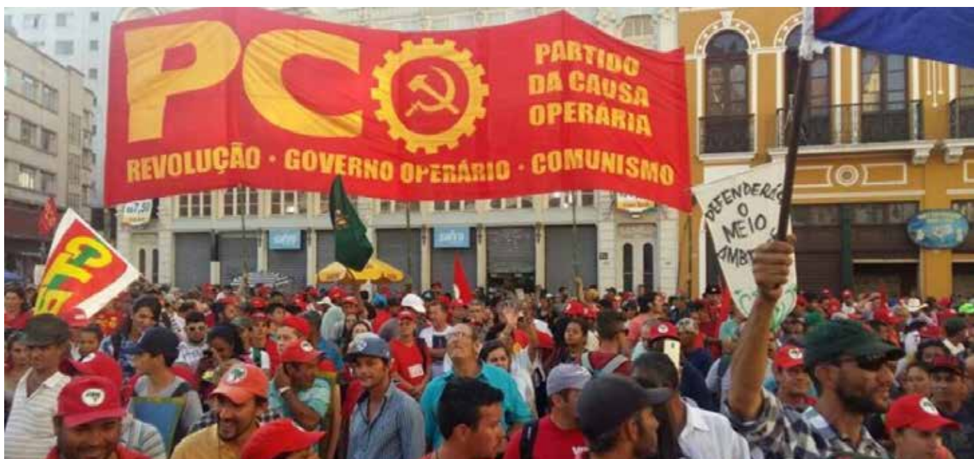
Revolução, governo operário, comunismo. Eis o lema do PCO.

H oje (19), cerca de 500 cidades do País recebem novos e gigantescos atos por vacina, auxílio e Fora Bolsonaro. Por volta de um milhão de pessoas estão nas ruas por esses objetivos imediatos.