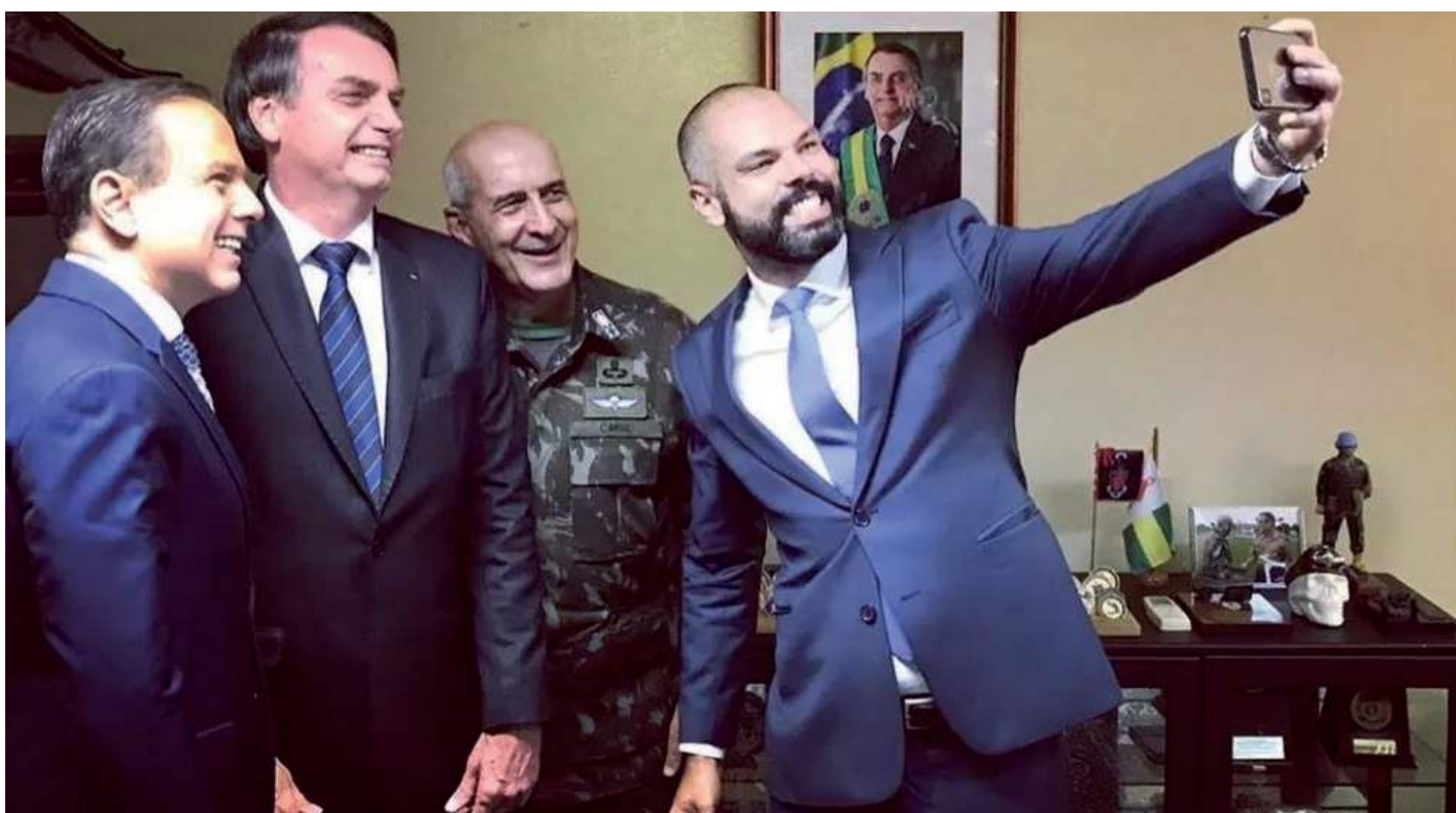
Covas, Doria e Bolsonaro: principais responsáveis pelas mortes na pandemia.

M orreu nesse final de semana o então prefeito de São Paulo, Bruno Covas.