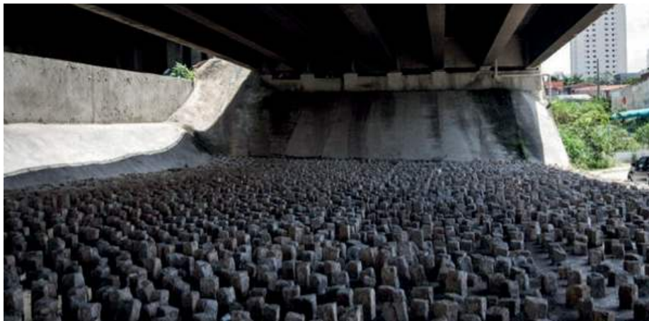
Covas instalou pedras debaixo de viadutos para impedir que moradores de rua dormissem lá.

Covas foi vice-prefeito de João Doria, quando o hoje governador implementou uma das mais ferozes administrações neoliberais da história de São Paulo e do Brasil. O número de moradores de rua cresceu, nesse período até 2020, mais de 60%.