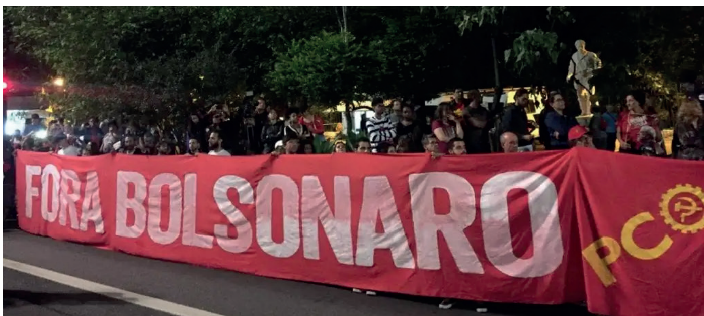
Lutar nas ruas pelas reivindicações populares.

H oje, milhares de trabalhadores, estudantes, mulheres, negros, sem terra, sem teto, enfim, toda a população oprimida, saem às ruas do País.